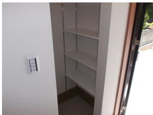
シューズインクローゼット