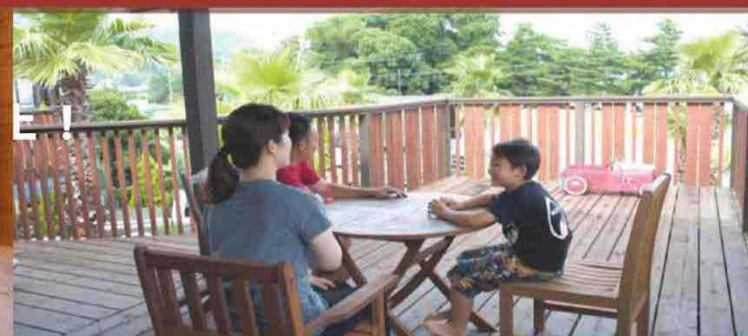
吹抜け、薪ストーブ+ウッドデッキのスローライフ