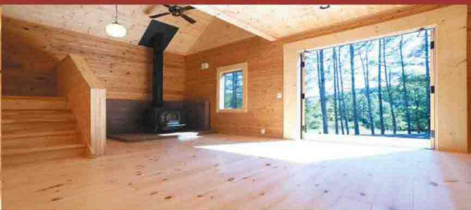
暖かくて柔らかい、裸足が快適な天然ムク板