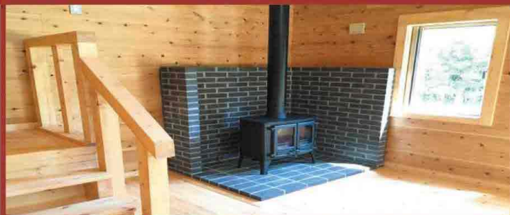
家族や友人と薪ストーブを囲んで団らん