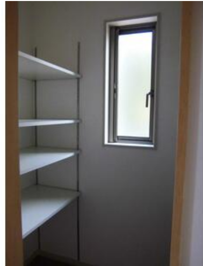
シューズインクローク