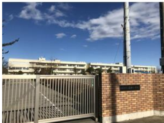
木更津市立岩根小学校まで1,708m