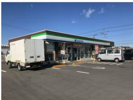
ファミリーマートサカモト高柳店まで883m