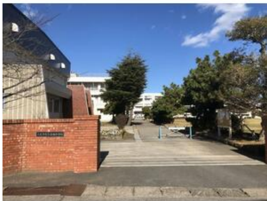
木更津市立岩根中学校まで336m