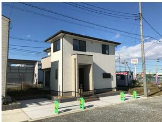
西側5m幅道路に全面接