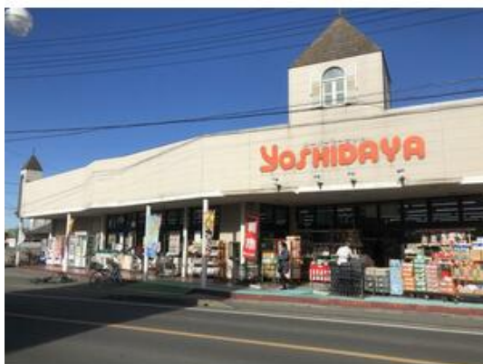
スーパーヨシダヤまで1,400m