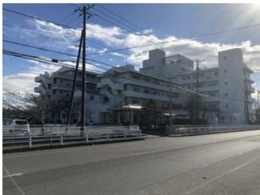
社会医療法人社団同仁会木更津病院まで1,512m