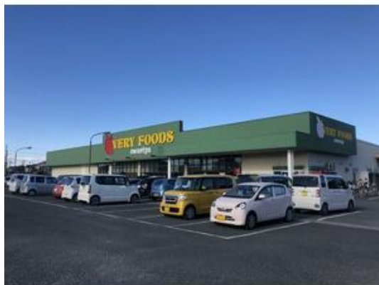
VERY FOODS尾張屋岩根店まで953m