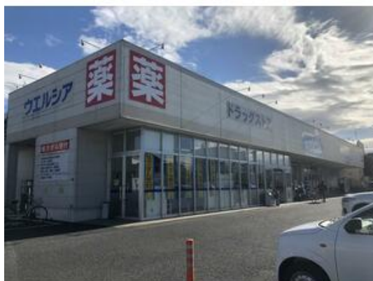
ウェルシア木更津高柳店まで241m