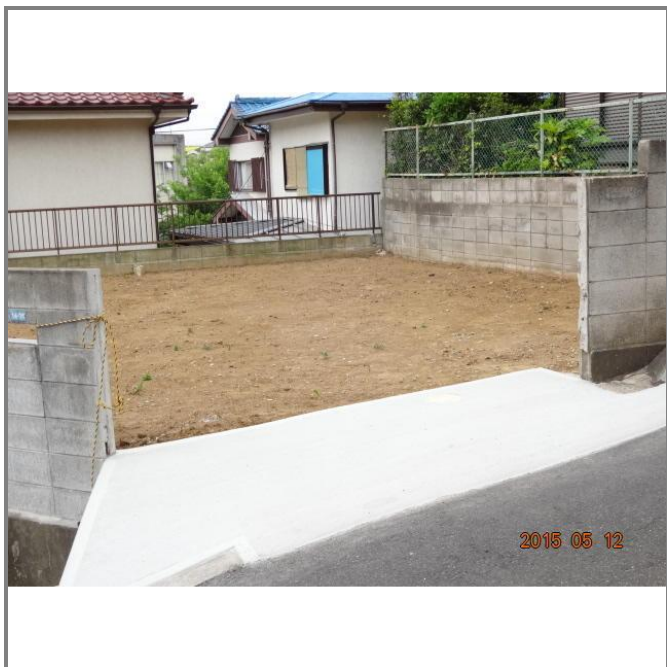
入口スロープ、拡張工事完成