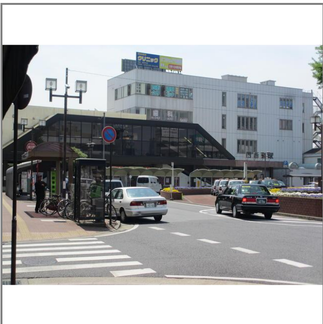
最寄りの四街道駅