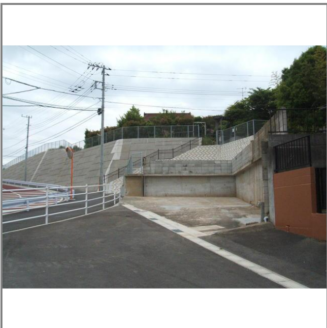
対象地(上段、写真上部の赤い屋根の見える場所です)