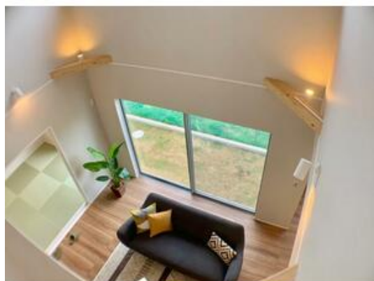
光と風を取り込む吹抜け