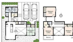
4号棟 3350万円 大開口の吹抜けで明るいリビング、家族の動線を考えたリビング階段