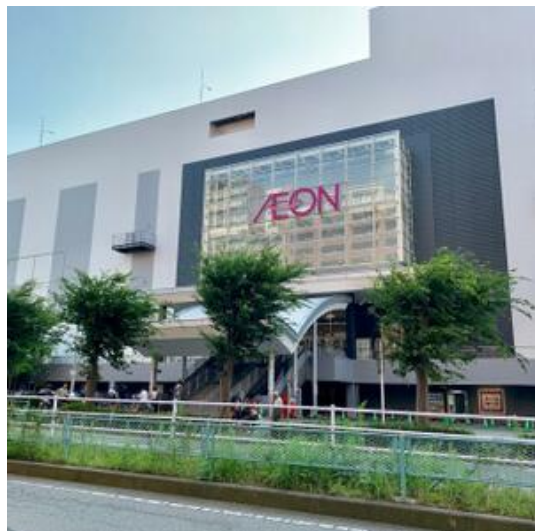
イオンモール八千代緑が丘まで1,600m