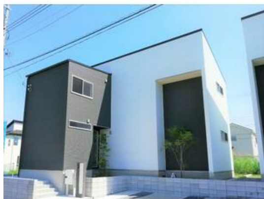
まるで絵画のような大胆な外観デザイン(5号棟)