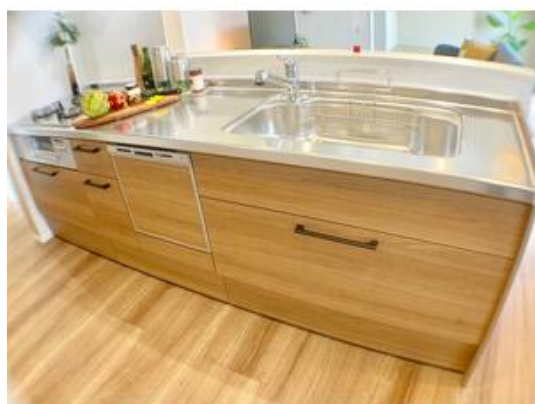
木目のキッチンで温もりを感じます