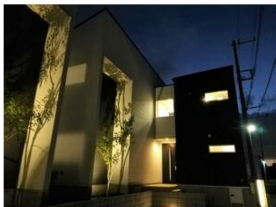
綺麗にライトアップされた外観(4号棟)