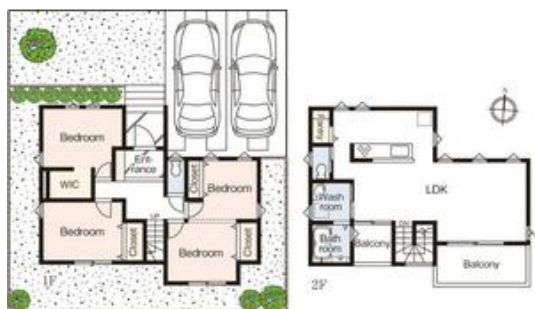
2号棟 3300万円 2階にリビングと水回りを配置した間取りが特徴の2号棟