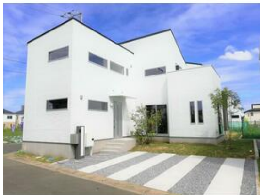
北西角地の1号棟。駐車スペース2台。(1号棟)