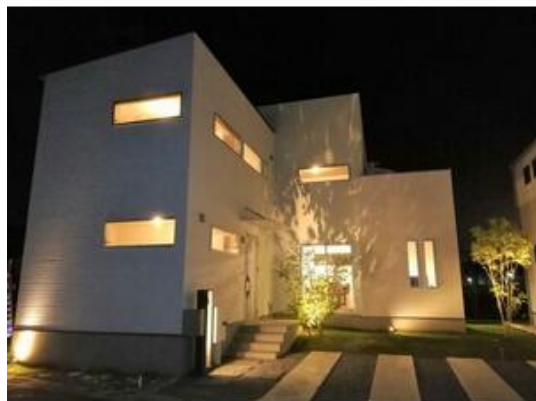
ライトアップされた建物は高級感を演出します。(1号棟)