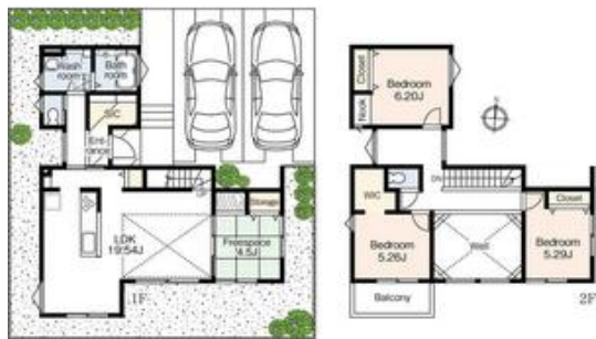
4号棟 3350万円 大開口の吹抜けで明るいリビング、家族の動線を考えたリビング階段