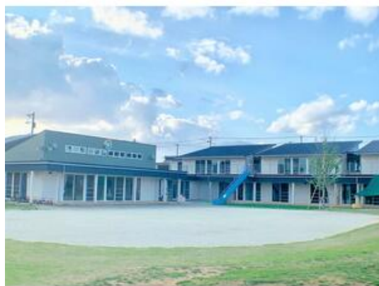
虹のころ保育園まで400m