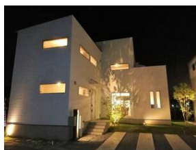
ライトアップされた建物は高級感を演出します。(1号棟)