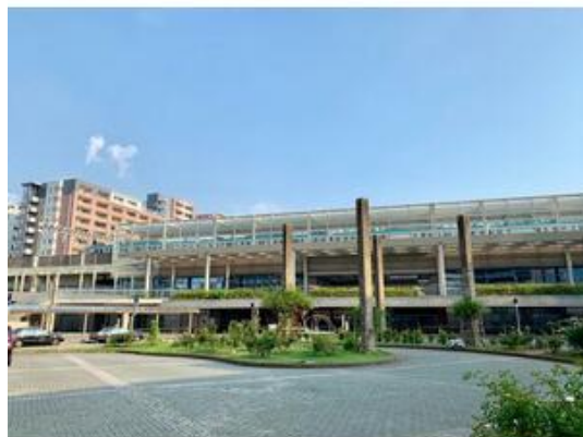
東葉高速鉄道「八千代緑が丘」駅まで1,700m