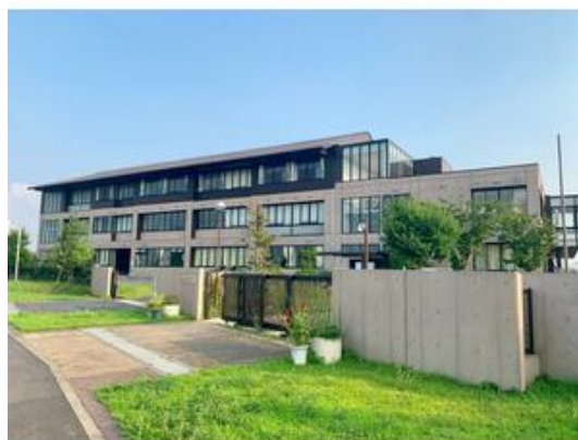
みどりが丘小学校まで490m