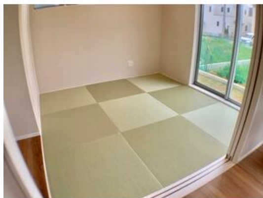
1F和室のふち無し畳は高級感を演出します