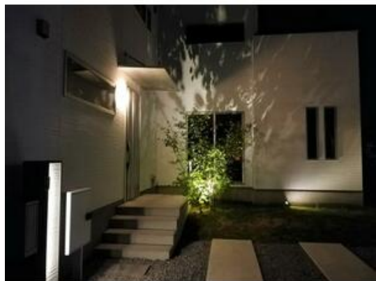
高級感漂うライトアップされたエントランスアプローチ(1号棟)