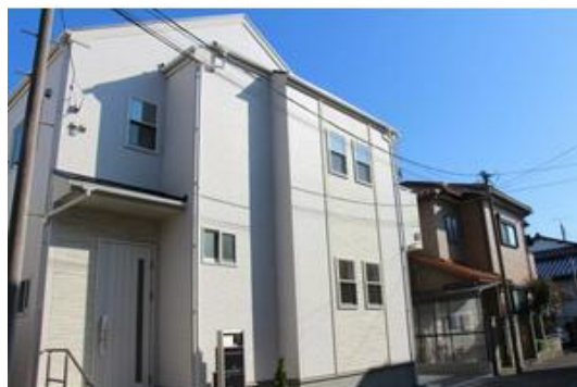
四街道市大日1棟 外観