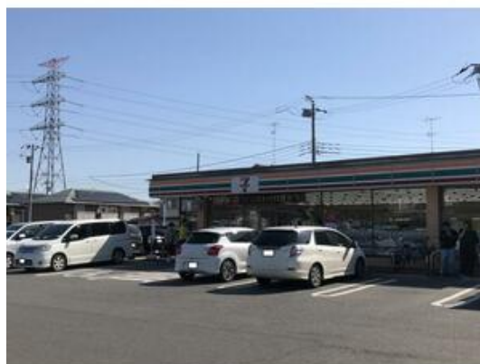
セブンイレブン四街道物井店まで617m