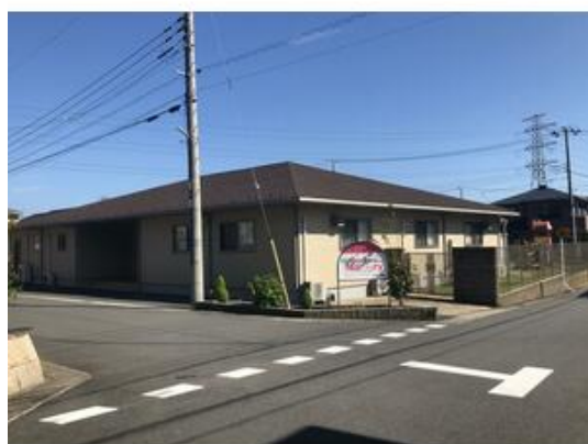
ココファン・ナーサリーもねの里まで439m