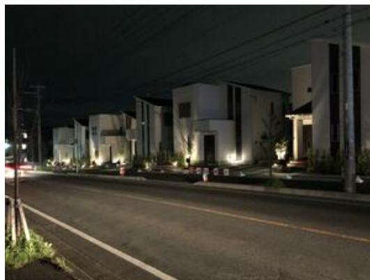
夜間ライトアップ 全体外観