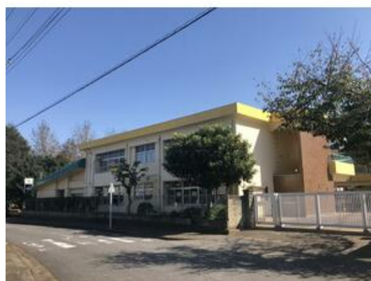
千代田幼稚園まで1,301m