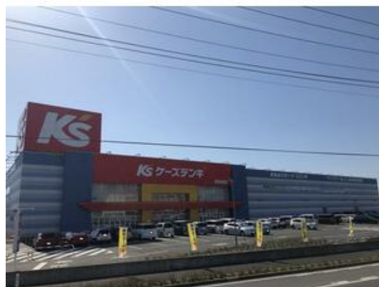
ケーズデンキ四街道店まで677m