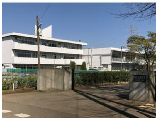
四街道市立南小学校まで965m