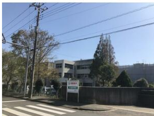
四街道市立千代田中学校まで1,306m