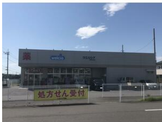
ウエルシア四街道もねの里店まで183m

売戸建住宅 3,180万円 四街道市もねの里6丁目 タマタウン四街道もねの里 号棟番号:3号棟