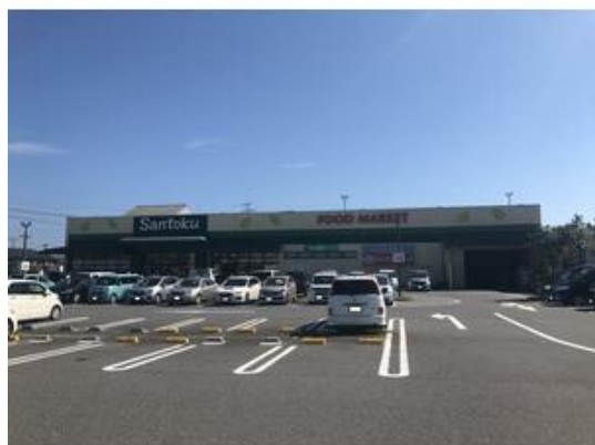
スーパーマーケット三徳四街道店まで456m