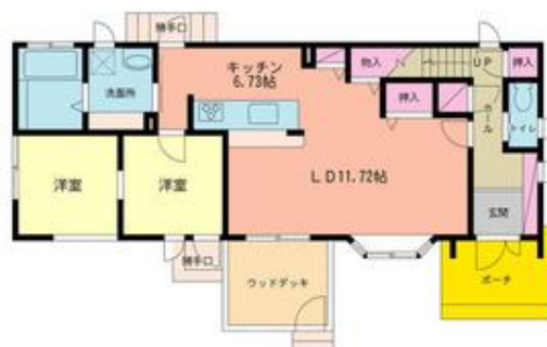
別邸の1階間取り図