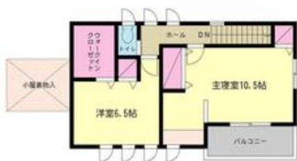
別邸の2階間取り図