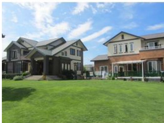
敷地内に別邸他、ガレージ車庫あり