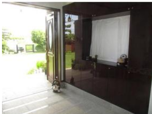
豪華な玄関ホール