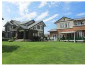
敷地内に別邸他、ガレージ車庫…