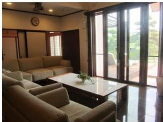
吹き抜けのあるリビング