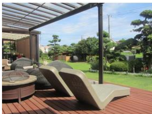
お庭に面するウッドデッキ