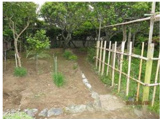
家庭菜園できます