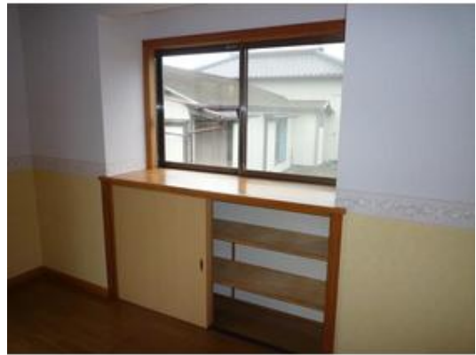
出窓の下に収納庫