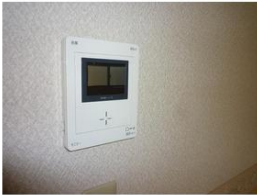
テレビインターホン