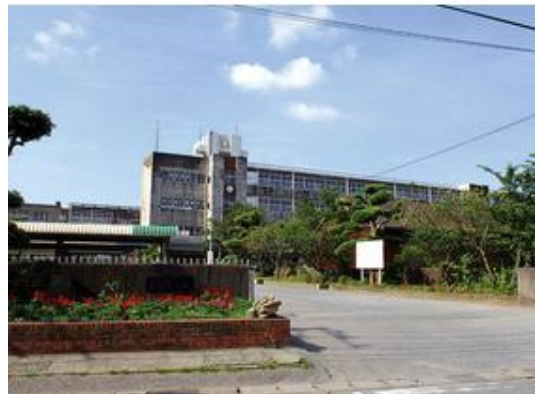
富津市立富津中学校まで3,800m