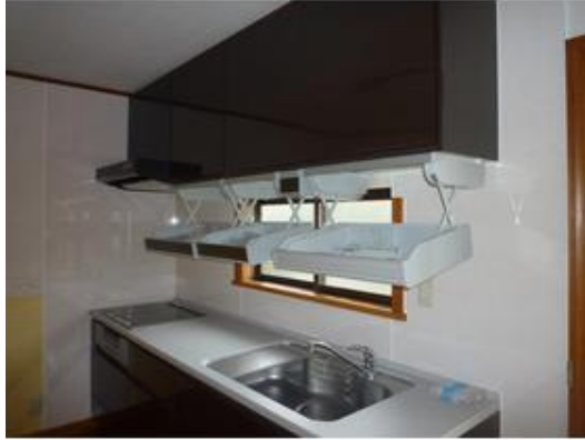
吊戸棚の下に小物入れ