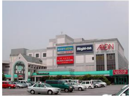
富津ジャスコ、イオンモールまで3,600m