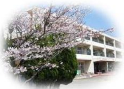
富津市立富津小学校まで700m