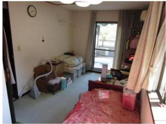
2階の洋室の天井には屋根裏収納も有ります。