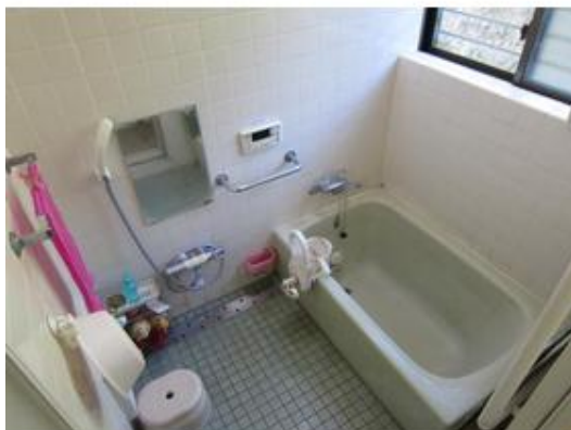
追い炊き式のバス