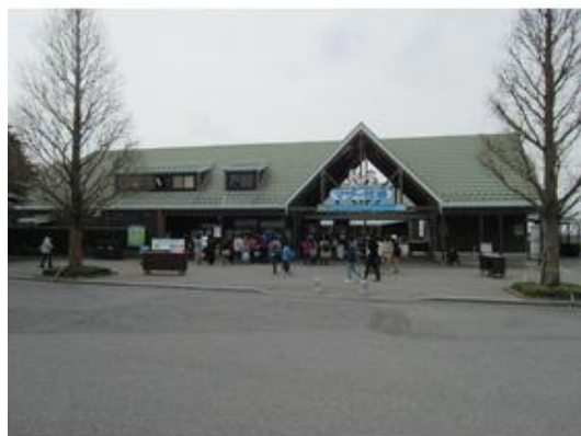
マザー牧場へは車約20分前後ですまで9,000m