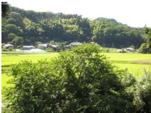
バルコニーからの眺望 のどかな田園風景を堪能！