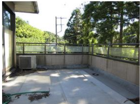
広々としたバルコニー