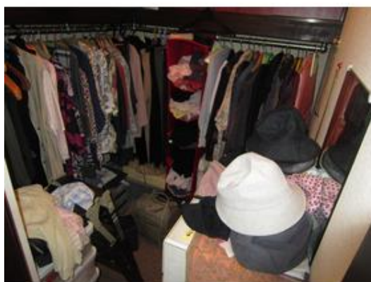
ウォークインクローゼットも有り、衣類などの収納に便 利です。