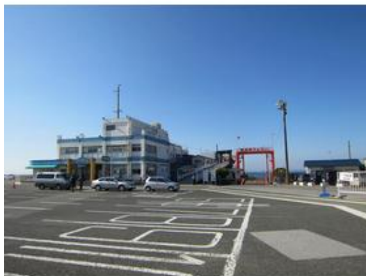
東京湾フェリー金谷港 近くには飲食店など商業施設も ございますまで9,000m