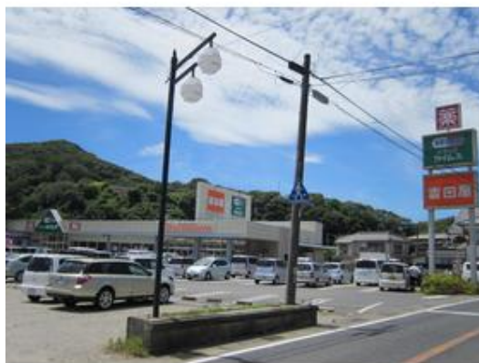
スーパー吉田屋とドラッグストア「セームス」まで6, 700m