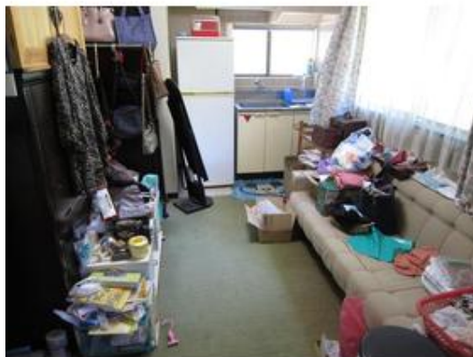
二世帯やゲストルームに便利なお部屋にはミニキッチン 台も有ります。