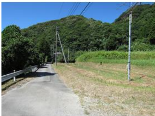
敷地内写真 建物南側の敷地では家庭菜園やドックラン など多種多様に使えそうです。まで10m