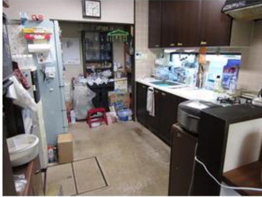
独立したキッチン