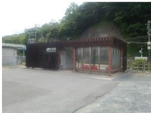
JR内房線「竹岡駅」まで6,000m