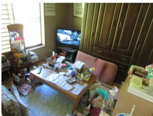
和室と二間続きです。