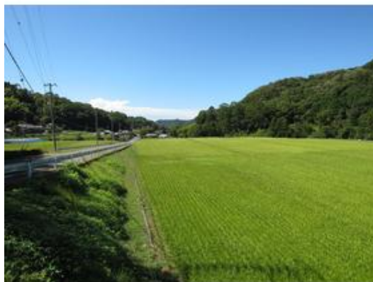
現地周辺写真 静かでのどかな田園風景を楽しむ場所 に物件がございますまで100m