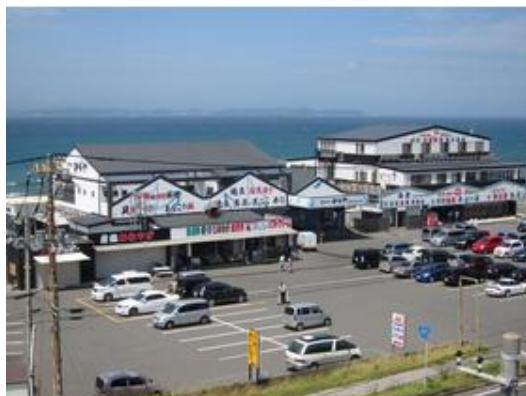
かなや(日帰り温泉入浴・食事処)まで8,000m