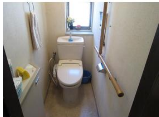
1階トイレ 2階にもトイレがございます。