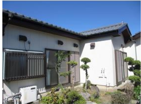
建物外壁塗装済みです！！