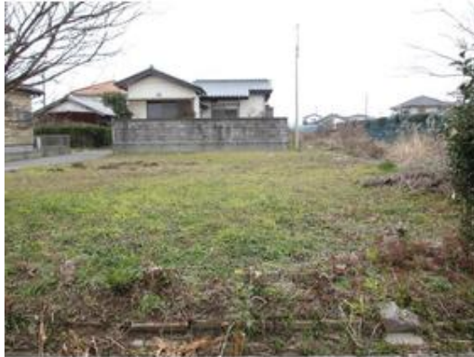
隣接地を東側から撮影しました。