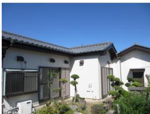
西側から撮影した外観です。