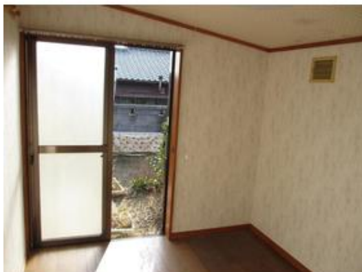
建物西側には小さなお部屋があります。はなれとしても倉庫としても活用できます。