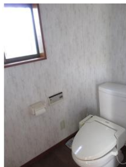
ウォシュレットトイレです。