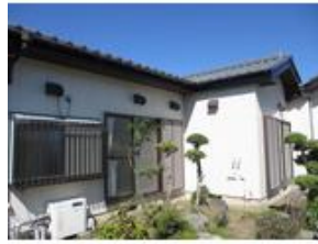
建物外壁塗装済みです！！