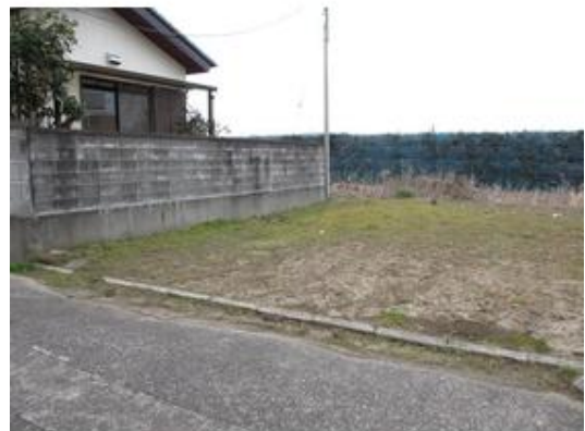
55坪の隣接地です。駐車スペースとしてだけでなく家庭菜園や倉庫の建設なども良いと思います。