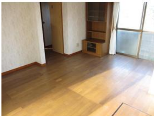
このお家のメインのお部屋になる、DKです。日当たり良好です。