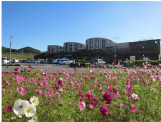
道の駅富楽里とみやま&高速バス停乗車場有りまで1,100m