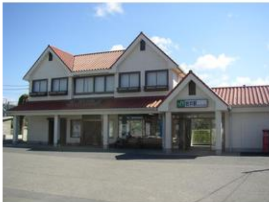
JR内房線 岩井駅まで1,600m