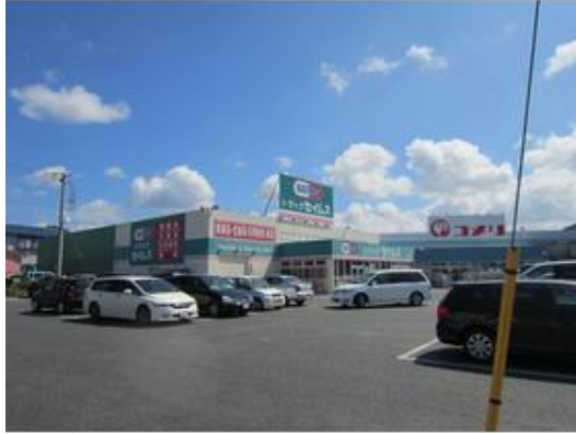
ドラッグセイムス岩井店まで1,432m