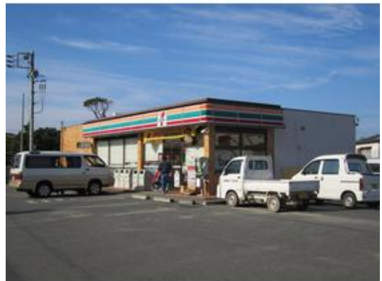
セブンイレブン安房富山高崎店まで1,900m