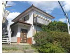
昭和60年築 倉庫あり