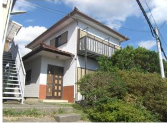
昭和60年築 倉庫あり