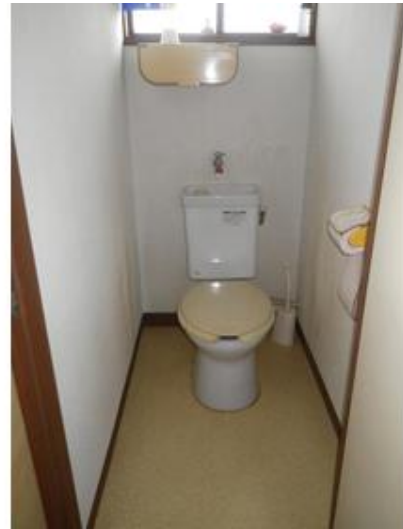
2Fトイレ・くみとりです