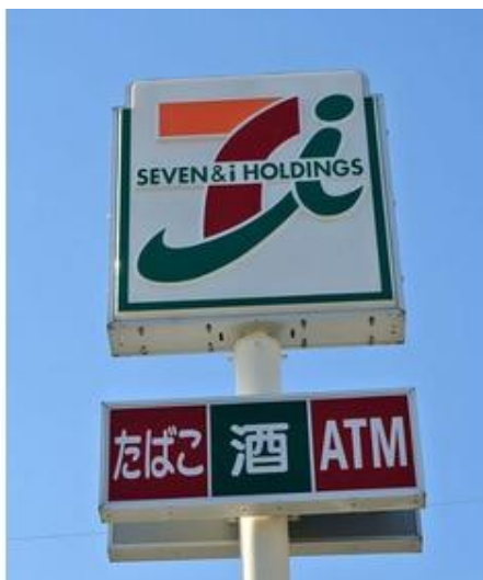
セブンイレブン館山稲店まで2,028m