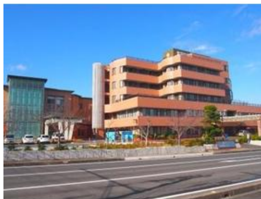
社会福祉法人太陽会安房地域医療センターまで2,063m