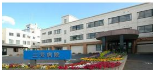
医療法人光洋会三芳病院まで2,382m