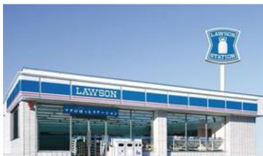
ローソン館山九重店まで2,076m