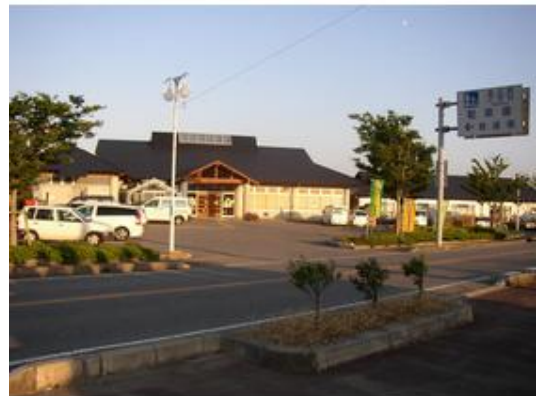
道の駅「鄙の里」まで5,600m