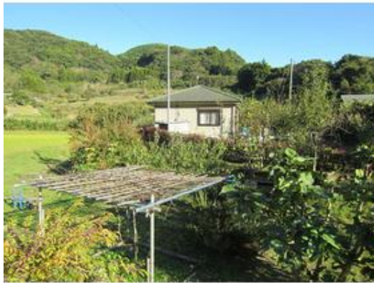
種類様々な果樹も豊富で、収穫も楽しみです