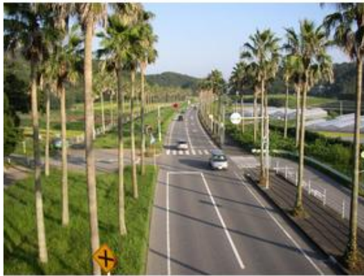
館山市内のバイパス通りには、商業施設が建ち並び買い物便利ですまで8,000m