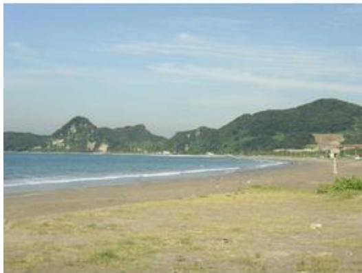
岩井海水浴場まで1,200m