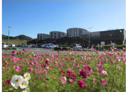
道の駅「富楽里」&高速バス乗車場まで1,070m