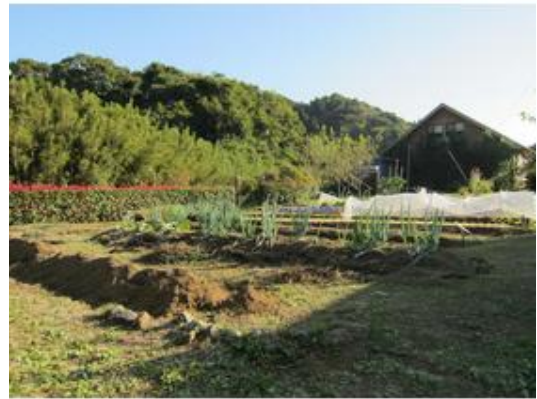
畑も綺麗に直ぐにでも使える状態です