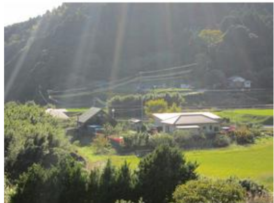
現地周辺写真まで200m