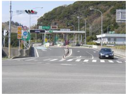
館山道「鋸南富山IC」下車約15分まで1,220m