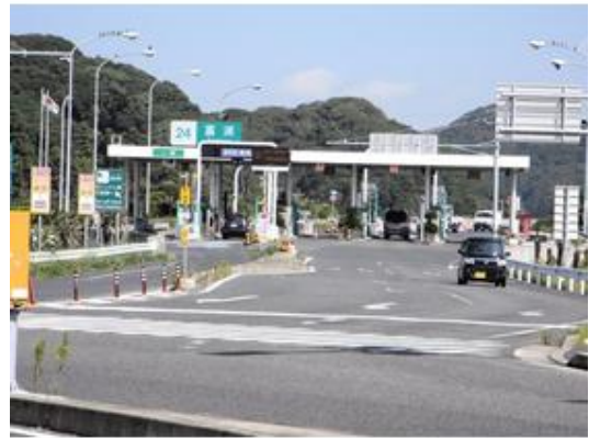
館山道富浦インター 2500m