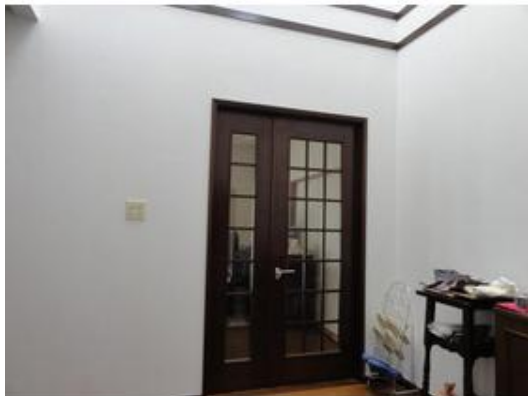
落ち着いた色合いの内装