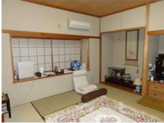
掘こたつのある和室は広縁付