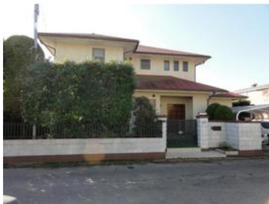
カーポートは2台分