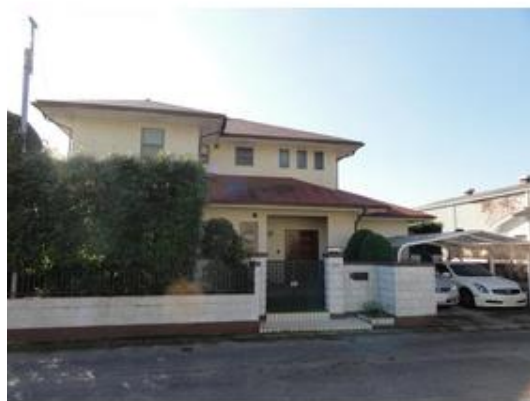
高級感あふれる外観