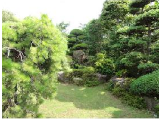
緑の木々が美しい庭