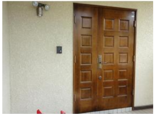
重厚感のある木製ドア