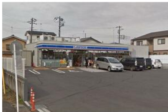
ローソン千葉祐光四丁目店まで162m