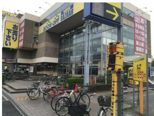
ブックオフSUPER BAZAAR東千葉祐光店まで321m