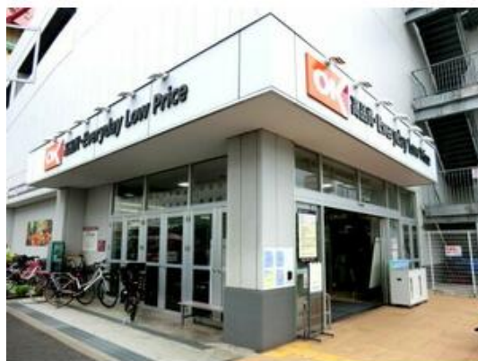
オーケー千葉中央店まで436m