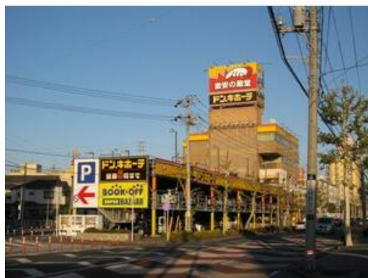
ドン・キホーテ千葉中央店まで219m