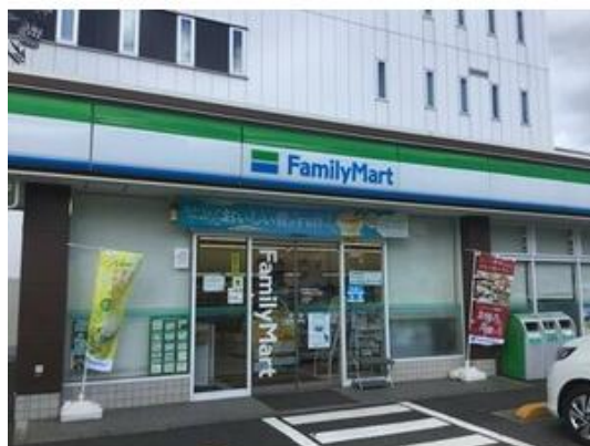
ファミリーマート千葉祐光三丁目店まで229m