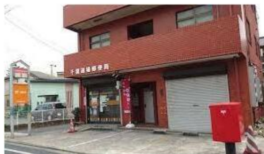
千葉道場郵便局まで538m