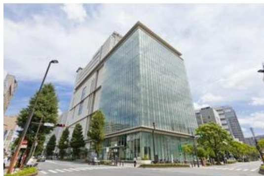
千葉市中央区役所まで1,742m