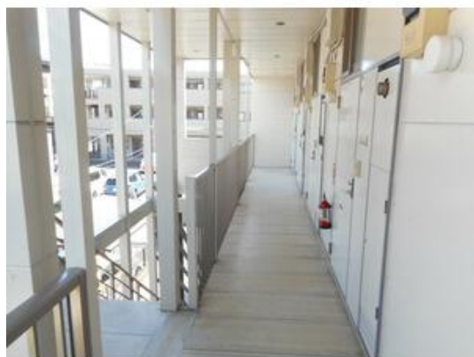
幅が広く歩きやすい共用廊下♪