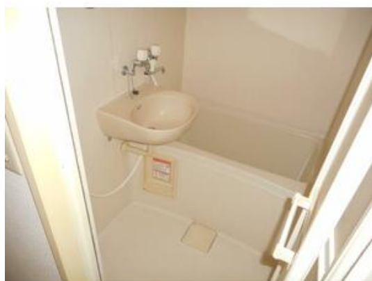
洗面台付で機能的なバスルーム♪