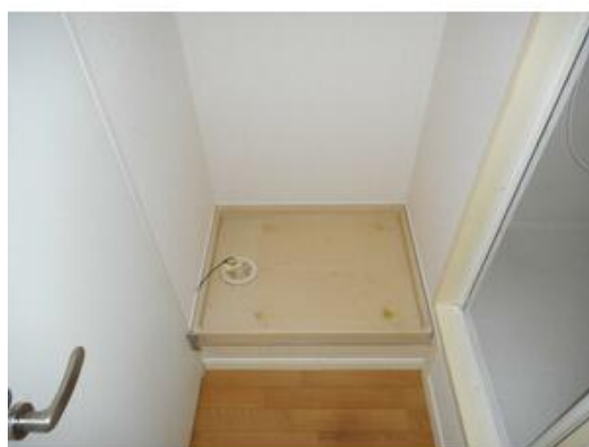
嬉しい室内洗濯機置場♪