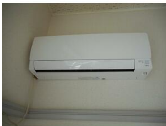
嬉しいエアコン付♪