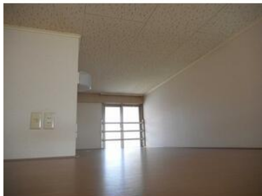
嬉しいロフト付♪ 寝室にもなります♪