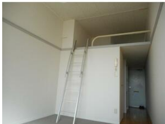
天井が高く、明るい室内♪