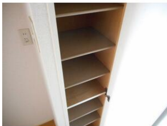
たくさんの靴が入る靴箱♪