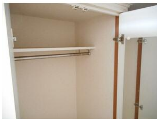
長尺物も収納可能なクローゼット♪