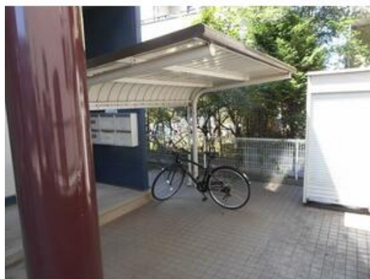
駐輪場は屋根付きです♪