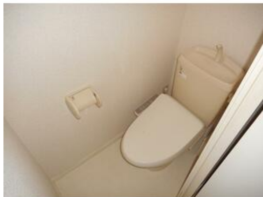
嬉しいウォッシュレット付♪

貸アパート 4.10万円 千葉市中央区千葉寺町 ロイヤルパーク一 番館 部屋番号:205号室