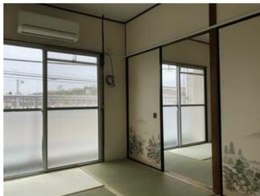
広く使える続部屋