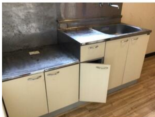
2口ガスコンロ設置可能