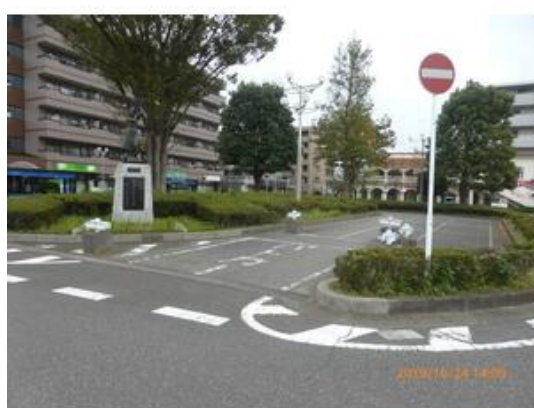
北国分駅北側ロータリーまで1,500m