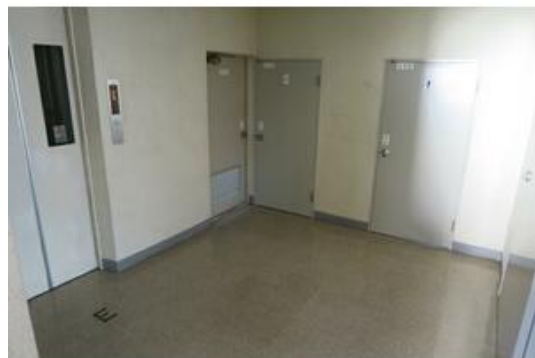
エレベーター前 トイレ入り口