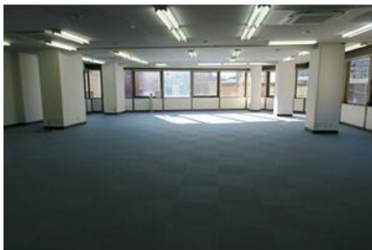
リフォーム済み 照明・ビルトインエアコン有り