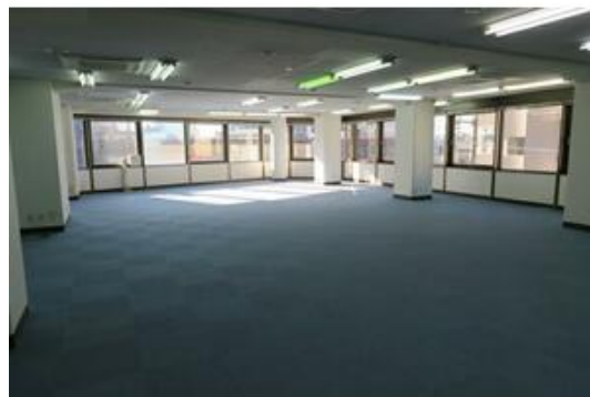
ブラインドカーテン付き