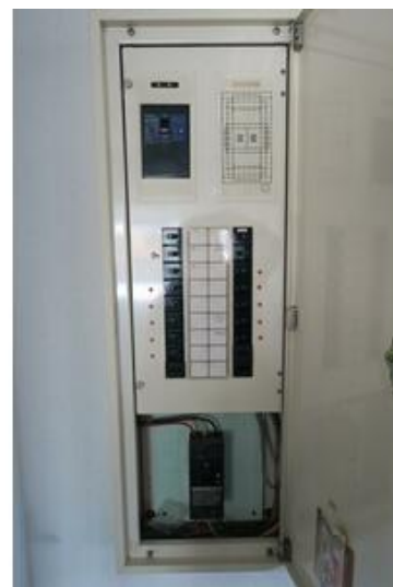
ブレーカー2ヶ所 動力有り