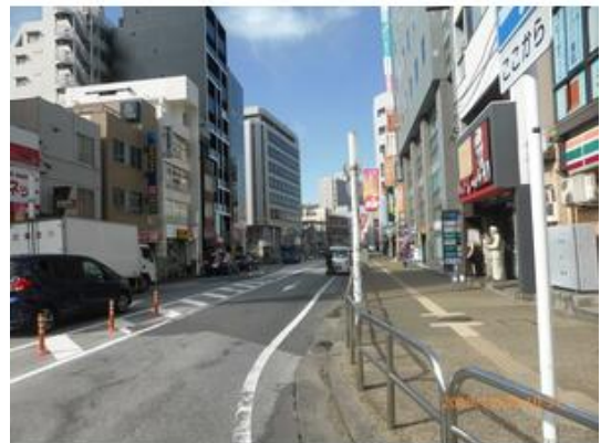
松戸駅西口駅前通りまで200m