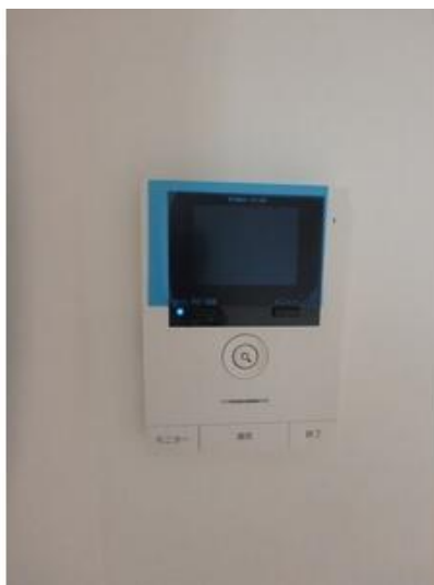
TVモニター付インターホン