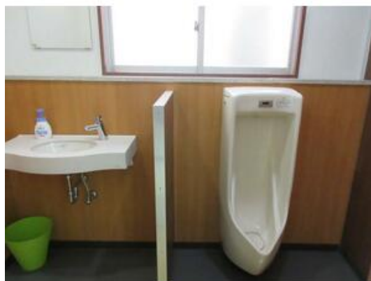
男子トイレと洗面所