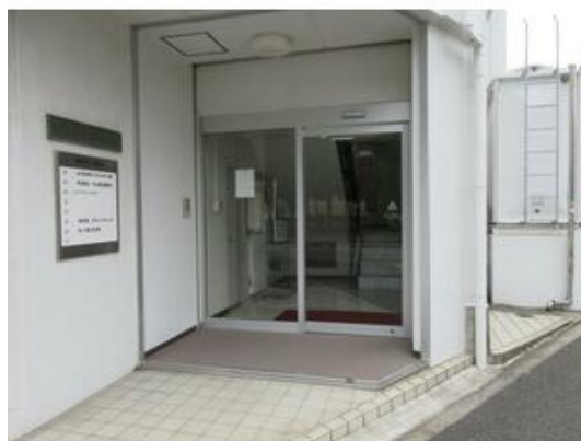
千葉県不動産会館の玄関