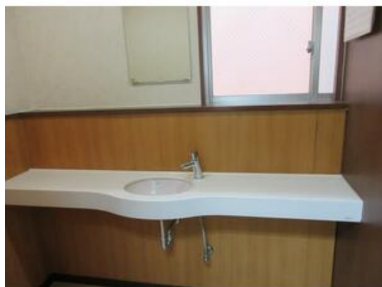
女子トイレ洗面所

貸店舗(一部) 10.67万円 千葉県美浜区高洲1丁目 千葉県不動産会館 部屋番号:3-B