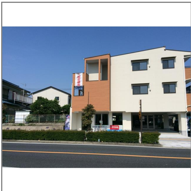
四街道市文化センターの斜向かいの物件で、交通量多く わかりやすい立地です。