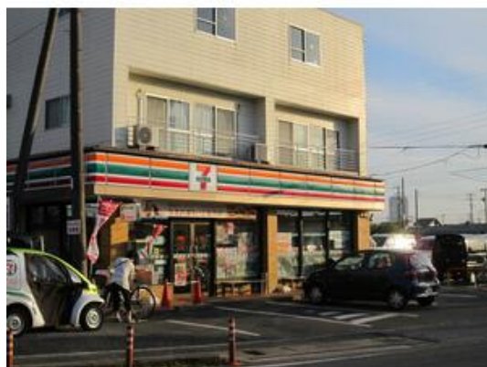
セブンイレブン市川曾谷店まで276m