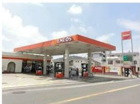
エネオス曾谷中央SSまで209m