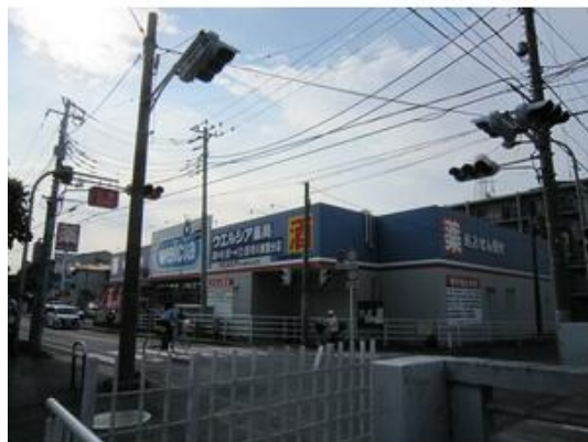
ウエルシア薬局市川東国分店まで538m