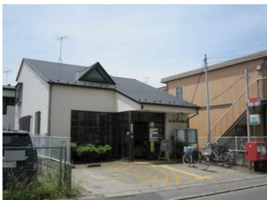
市川曾谷北郵便局まで729m