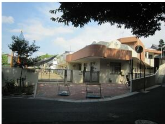
百合台保育園まで523m

貸店舗・事務所(一部) 15.40万円 市川市曾谷4丁目 カスガビル 部屋番号:203