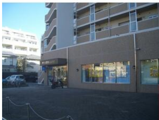
東京ベイ信用金庫宮久保支店まで1,253m