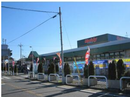
ユニディ曾谷店まで555m