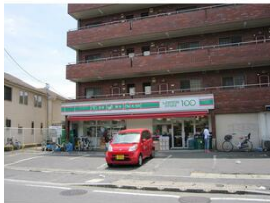
ローソンストア100市川曾谷店まで427m