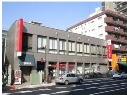
三菱UFJ銀行市川支店まで67m