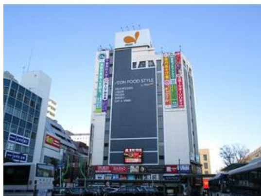
ダイエー市川店まで237m