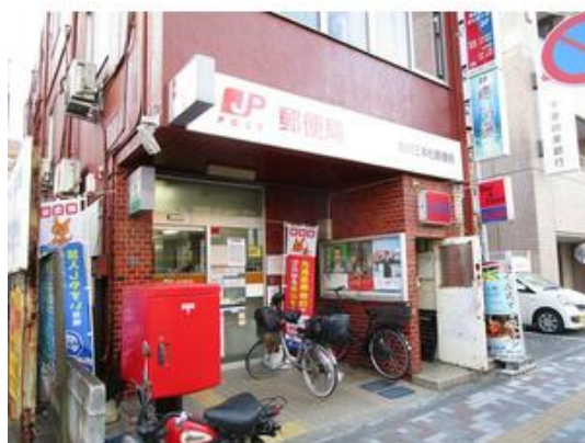
市川三本松郵便局まで85m