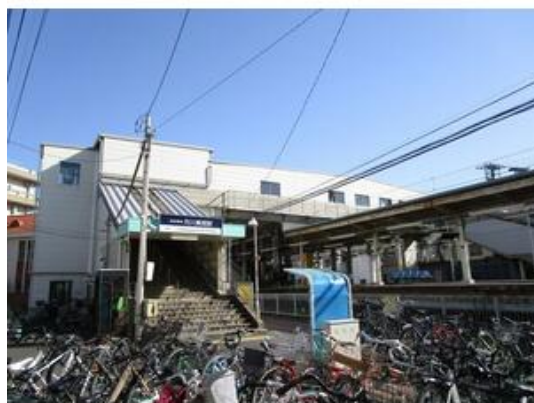
京成本線 市川真間駅