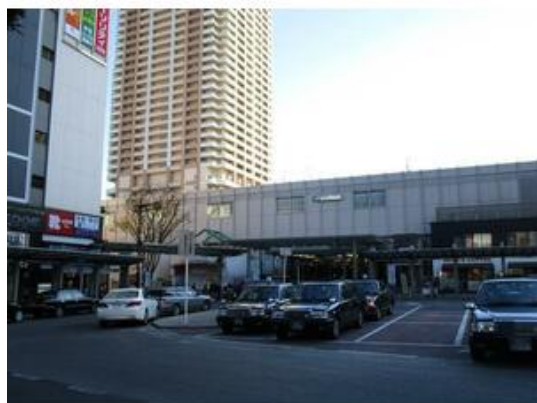
JR総武線 市川駅北口

貸店舗(一部) 31.32万円 市川市市川1丁目 アクティブ市川(アクティブイチカワ) 部屋番号:D