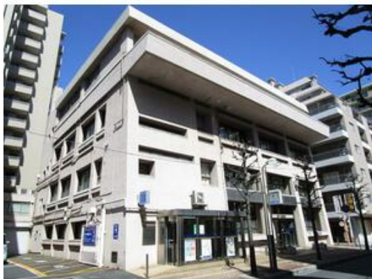
東京ベイ信用金庫本店まで82m

貸店舗(一部) 31.32万円 市川市市川1丁目 アクティブ市川(アクティブイチカワ) 部屋番号:D