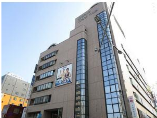
セントラルフィットネスクラブ市川まで70m