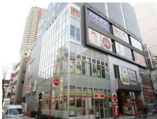
デイリーヤマザキアクティオーレ市川店まで152m