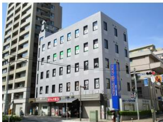
市川駅より徒歩3分