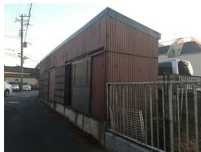
外観のお写真です。ぜひ、実際に現地 をご覧になってみて下さい。