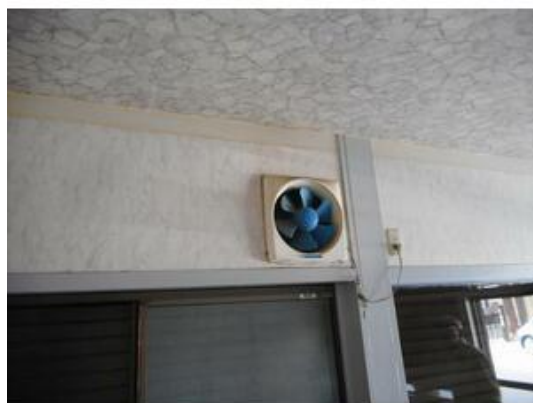
換気扇(残置物になります。)