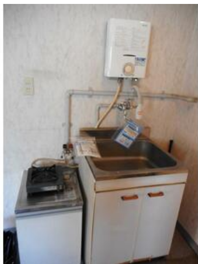
残置物になります。