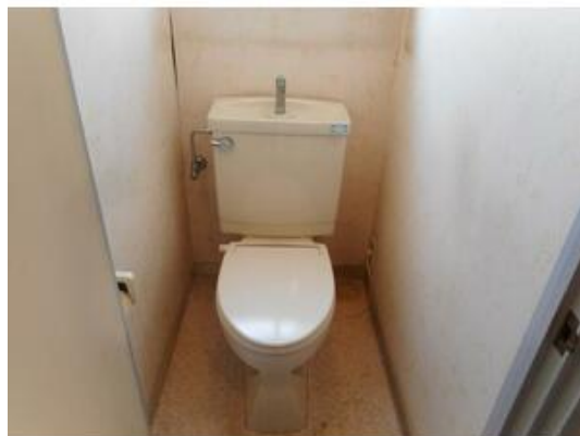
残置物になります。