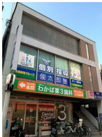
下総中山駅徒歩3分、2階路面店! 商店街通りに面し視認性 が良い物件です。1階は歯医者さん盛業中です。