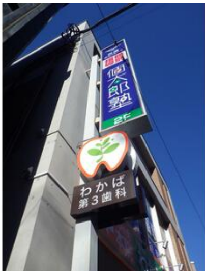
袖看板取り付け可能となります(大きさ制限がございます)