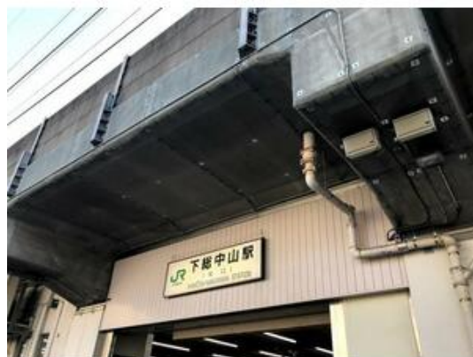
JR下総中山駅徒歩3分