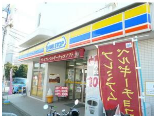
ミニストップ船橋行田店まで614m