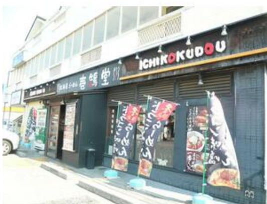
石鶴堂西船店まで1,201m