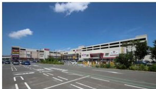
イオンモール船橋まで1,778m