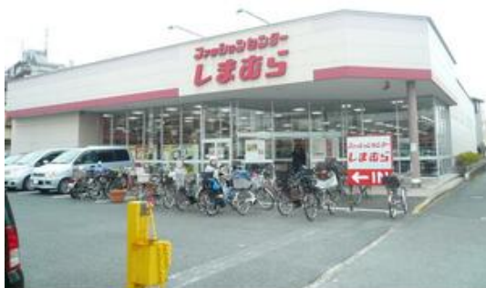
ファッションセンターしまむら西船店まで1,060m