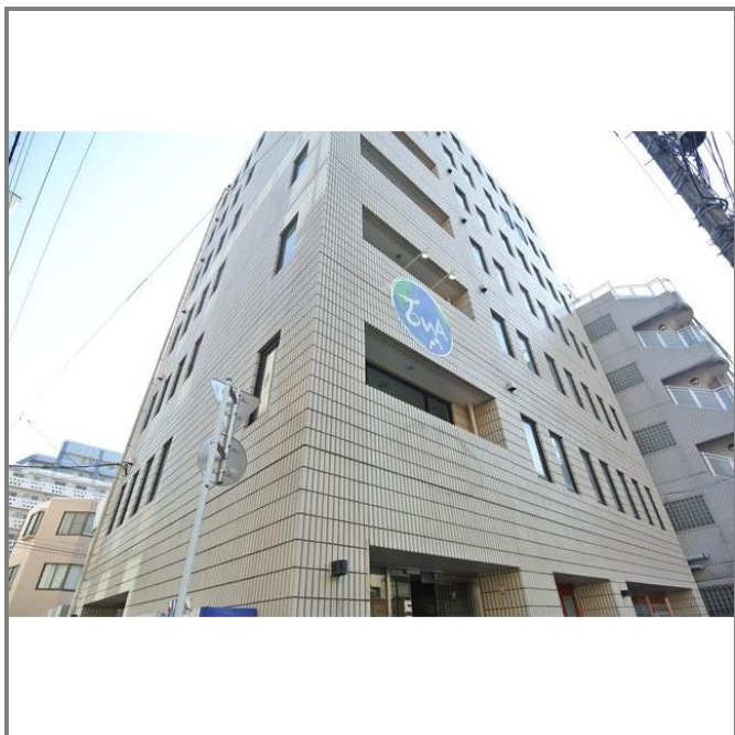
タイル貼りの外観