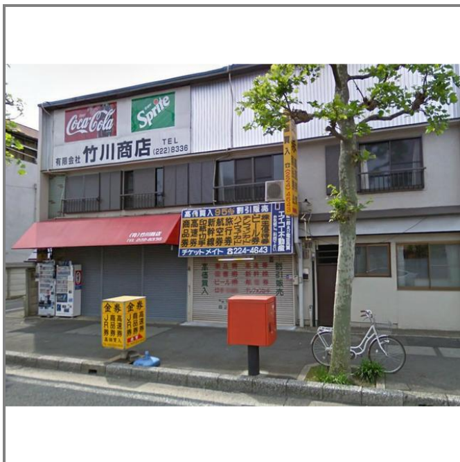
51号沿いで視認性がある立地です