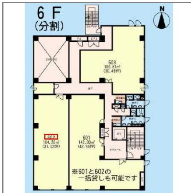
分割貸のイメージです。(当物件は602部分)

フリーレント:1ヶ月 最上階 O Aフロア 男女別トイレ 給湯 エアコン 個別空調 光ファイバー 防犯カメラ 火災警報器(報知機) エレベーター 施設内貸会議室