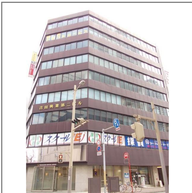
視認性が高い2階です