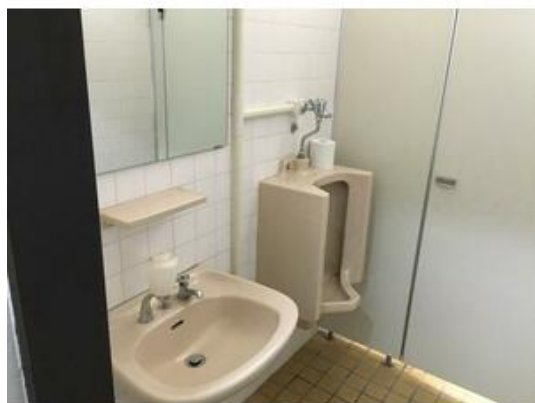
各階共用トイレ完備

貸店舗(一部) 22.264万円 船橋市前原西2丁目 平安堂医療ビル 部屋番号:4-A