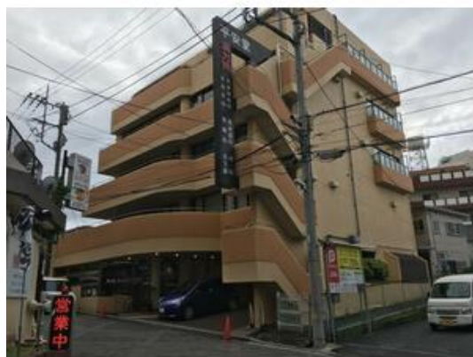
平成23年外装等リフォーム実施済 エントランスも改修されており綺麗な印象です