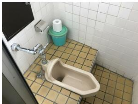
各階共用トイレ完備