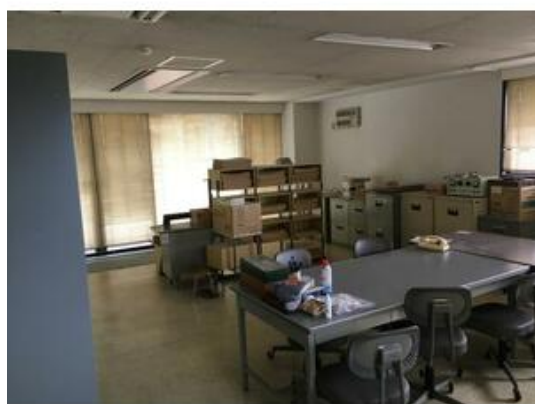
元会議室、休憩スペースとして利用されていました