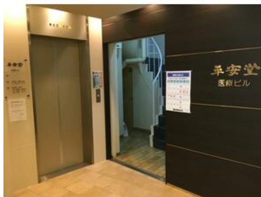
エントランス改修しており、綺麗な印象です