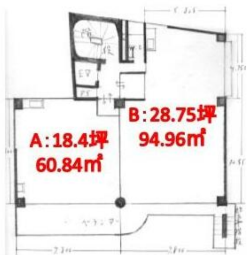
3-A 18.4坪 耳鼻咽喉科の設備・機器の残置物あり(造作譲渡代無償)

貸店舗(一部) 22.264万円 船橋市前原西2丁目 平安堂医療ビル 部屋番号:4-A