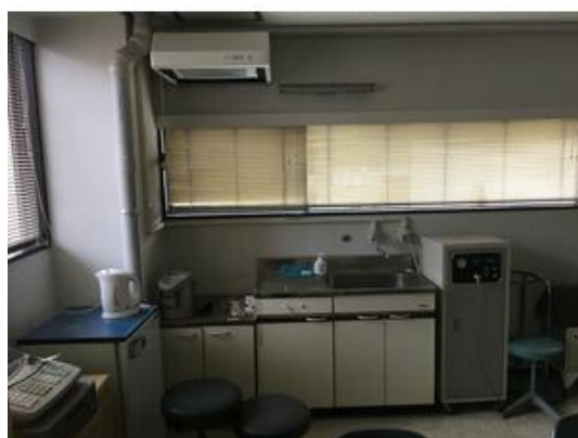
元会議室、休憩スペースとして利用されていました