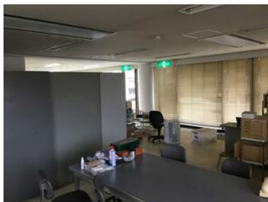
元会議室、休憩スペースとして利用されていました