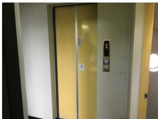
エレベーター1基完備