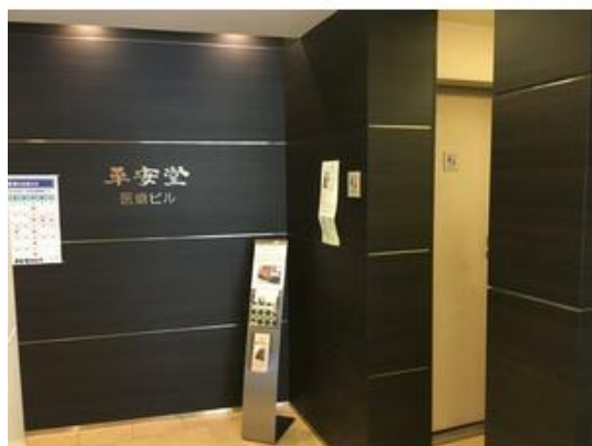
エントランス改修しており、綺麗な印象です