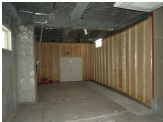
木部が仮設部分です