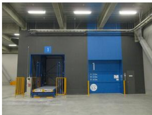
垂直搬送機・荷物用エレベーター

貸倉庫 1,909.60万円 習志野市茜浜2丁目 JRE習志野センター(ジェーアルイーナラシノセンター) 部屋番号:A区画